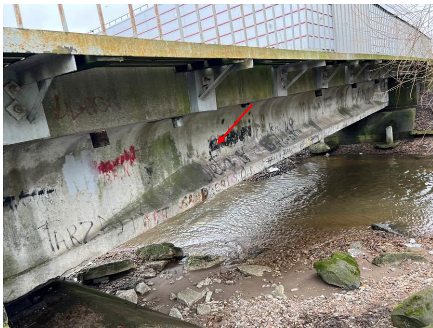
3.att. Grafiti uz laiduma konstrukcijas. Skats augšteces pusē.