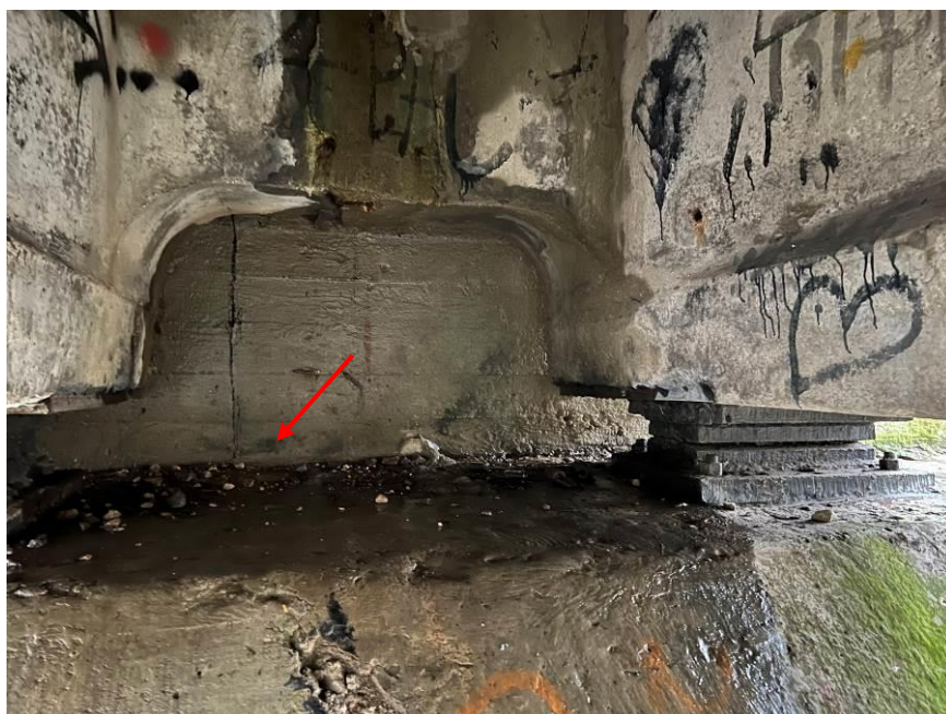
4.att. Sanesumi uz uzkalas. Skats uz krasta balsta Nr.2 uzkalas.