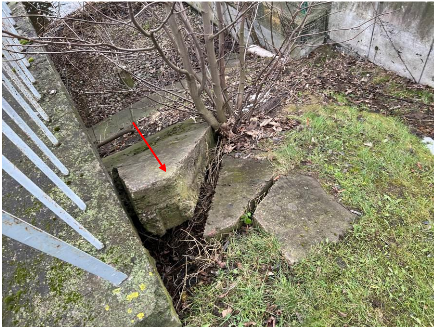
6.att. Paskalots konusa nostiprinājums. Skats pie krasta balsta Nr.2 lejteces pusē.