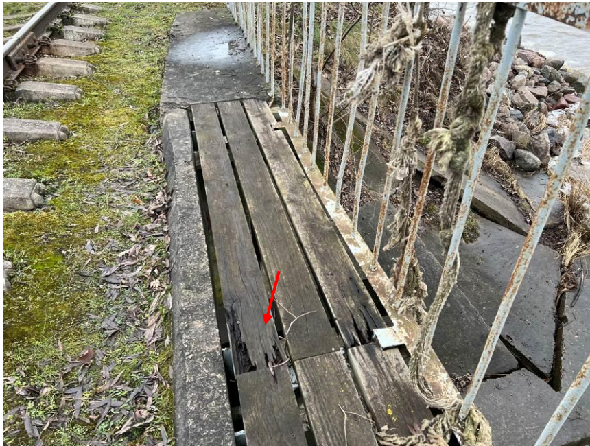
1.att. Viena dēļu kārtas klājs, bīstams trapes gadījumā. Skats uz ietvi lejteces pusē.