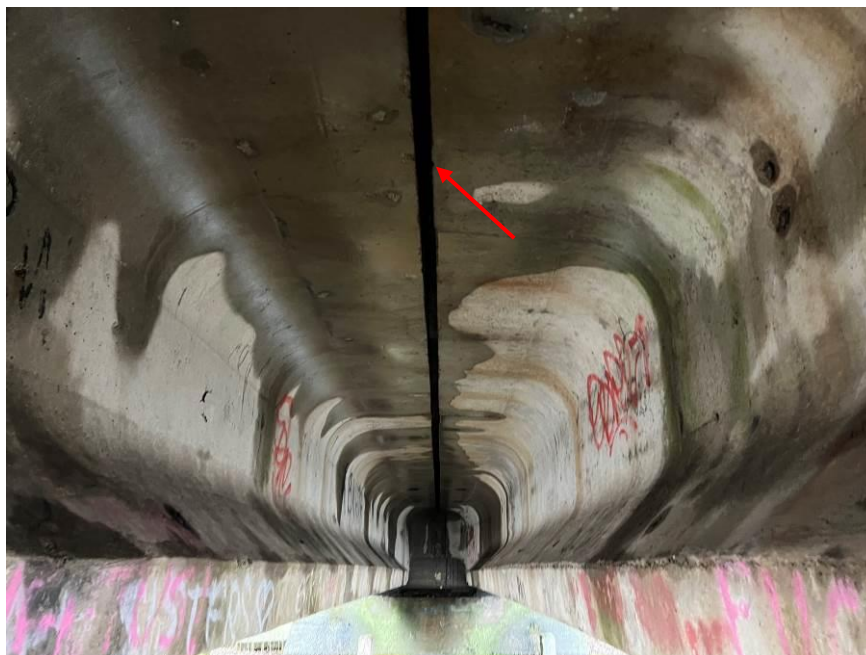
7.att. Ūdens caur plātni tek uz sijām. Skats no krasta balsta Nr.1 puses.