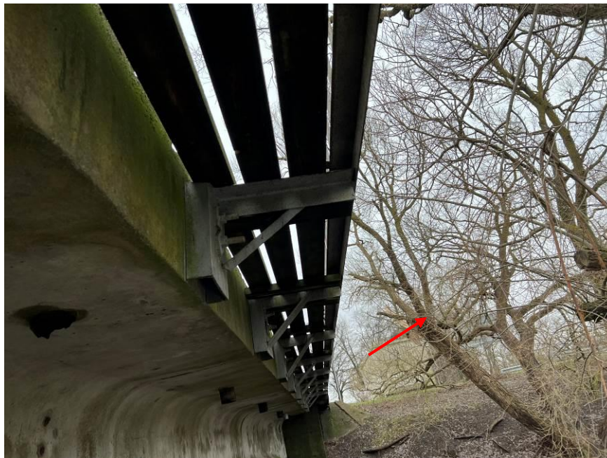
9.att. Veģetācija pie tilta.