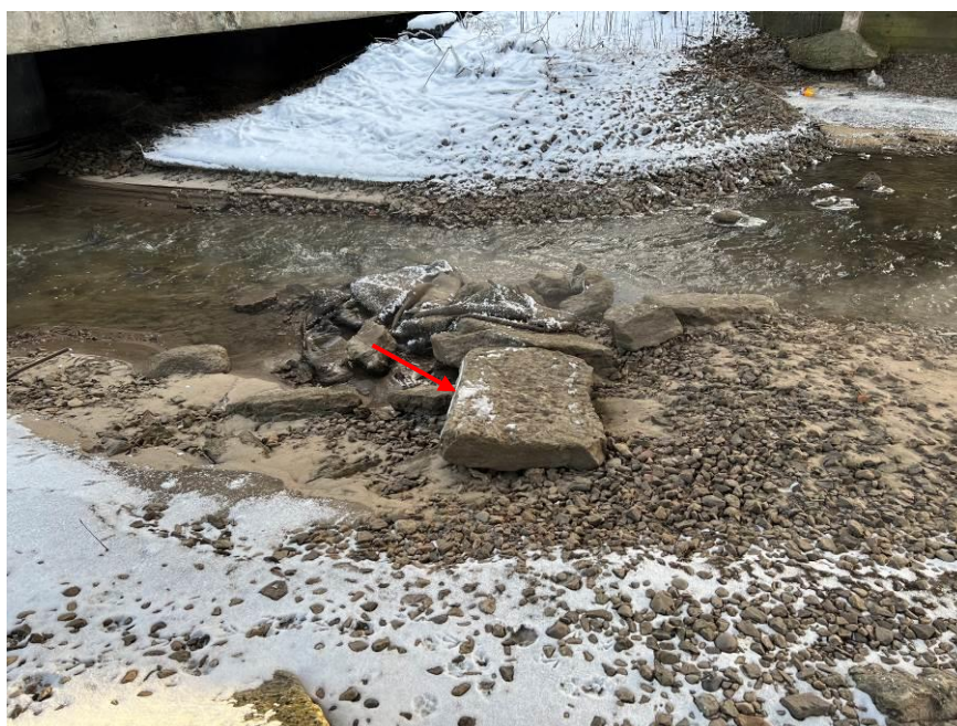
8.att. Sanesumi upes gultnē zem tilta.