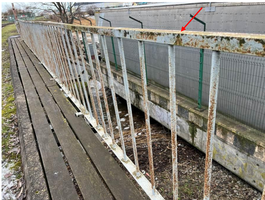
2.att. Margu korozija. Skats uz margām lejteces pusē.