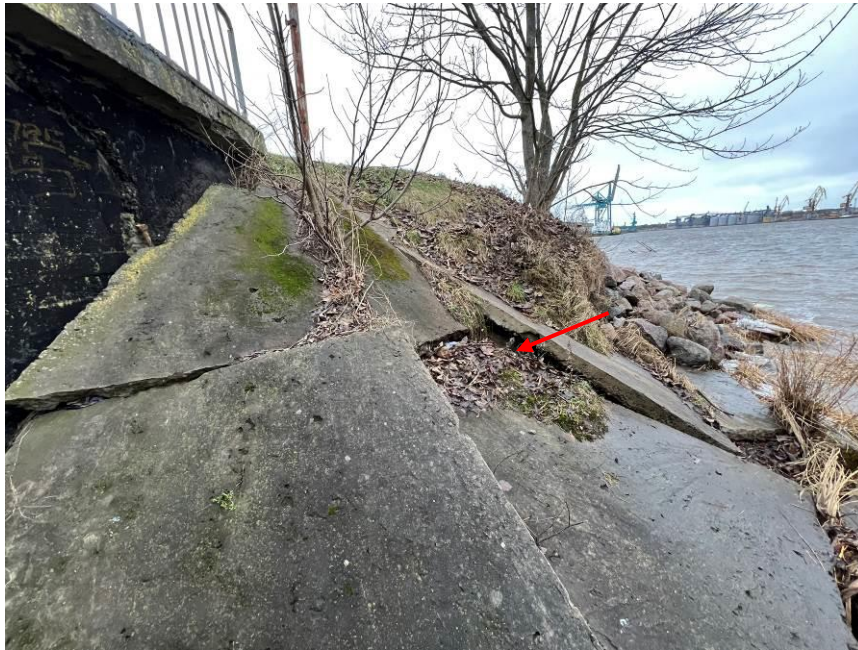
5.att. Paskalots un sabrucis konusa nostiprinājums. Skats pie krasta balsta Nr.1 lejteces pusē.